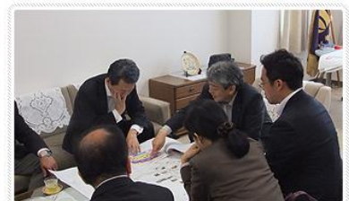
村の魅力伝える村長

村民目線で、サービス意識と経営感覚のある役場づくりをめざし、役場職員の意識改革や地域振興公社の再構築に取り組んでいます。併せて、村長自らが各地へ出向くトップセールスも進めています。